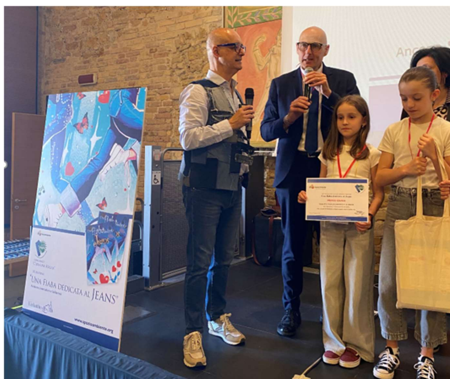
Con Massimiliano Sirotti – Assessore Politiche Educative, Sviluppo dei borghi e del territorio, Associazione del Comune di Urbino