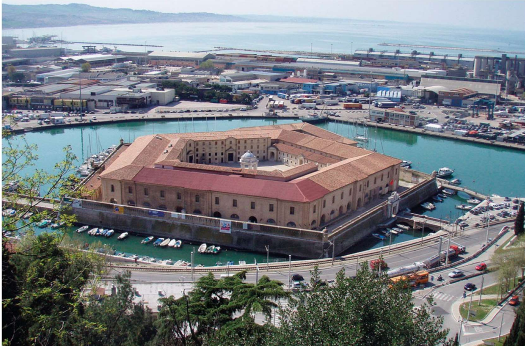
Mole Vanvitelliana in Ancona