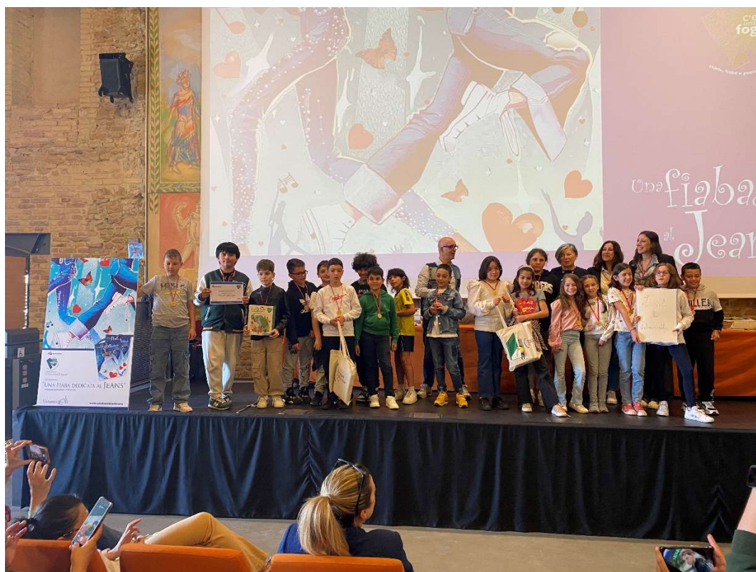
Classe IVA Scuola primaria "G. Marconi" di Loreto