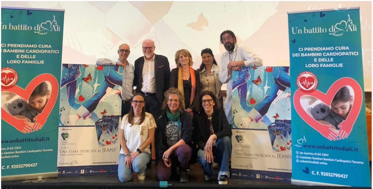
Con gli amici di "Un battito di Ali"